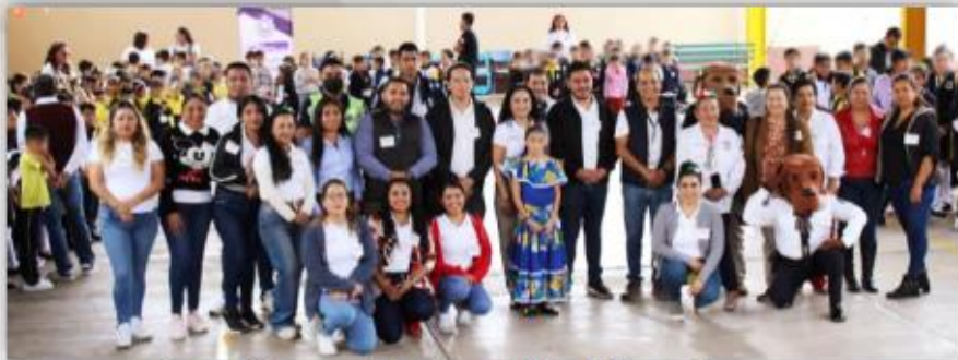
Ceremonia inaugural de la Escuela Primaria Cuauhnáhuac

El día 05 de septiembre de 2025, personal de la DECEECyPC acudió a las instalaciones de la Escuela Primaria Cuauhnáhuac, ubicada en calle Pedro Alvarado, sin número, colonia Lomas de Cortés, del municipio de Cuernavaca, Morelos a efecto de sumarnos a las actividades de la Kermés Patria "Conociendo mis Raíces, Morelos":