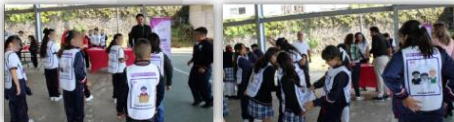
Implementación del juego didáctico “Casacas”

En dicha actividad se implementó el juego didáctico denominado “Casacas”, consistente en un memorama que contiene hasta 60 conceptos democráticos que reta a la memoria de las y los participantes para poder recordar tales conceptos e ir encontrando pares, lo cual fomenta promoción de la cultura cívica y democrática en el alumnado de dicha institución educativa.