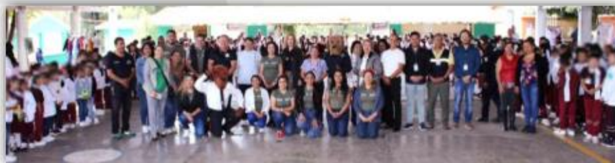
Ceremonia inaugural de la de la Escuela Primaria Justo Sierra

El día 04 de septiembre de 2025, personal de la DECEECyPC acudió a las instalaciones de la Escuela Primaria Justo Sierra, ubicada en calle Campo Militar, número 24, colonia Buena Vista, del municipio de Cuernavaca, Morelos a efecto de sumarnos a las actividades de la Kermés Patria "Conociendo mis Raíces, Morelos":