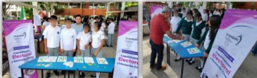
Implementación del juego didáctico "Lotería Electoral"

En esta actividad se implementó el juego didáctico denominado "Lotería Electoral", que enseña varios conceptos de manera divertida, contiene hasta 60 cartas y 6 tableros, las y los participantes eligen un tablero, la persona moderadora del juego va dando vuelta a las 60 cartas para que los jugadores vayan colocando fichas en sus tableros, gana la persona jugadora que logre llenar su tablero antes que el resto, por lo que se debe estar atento a los conceptos en todo momento, con lo cual se fomenta promoción de la cultura cívica y democrática en el alumnado de dicha institución educativa.