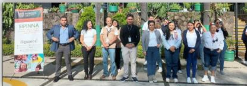
Ceremonia inaugural de la de la Escuela Primaria Atlamiliztli

El día 03 de septiembre de 2025, personal de la DECEECyPC acudió a las instalaciones de la Escuela Primaria Atlamiliztli, ubicada en Camino antiguo a Tepoztlán, colonia Buenavista, del municipio de Cuernavaca, Morelos a efecto de sumarnos a las actividades de la Kermés Patria “Conociendo mis Raíces, Morelos”: