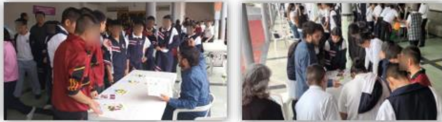
Implementación del juego didáctico "Lotería Electoral"

En esta actividad se implementó el juego didáctico denominado "Lotería Electoral", que enseña varios conceptos de manera divertida, contiene hasta 60 cartas y 6 tableros, las y los participantes eligen un tablero, la persona moderadora del juego va dando vuelta a las 60 cartas para que los jugadores vayan colocando fichas en sus tableros, gana la persona jugadora que logre llenar su tablero antes que el resto, por lo que se debe estar atento a los conceptos en todo momento, con lo cual se fomenta promoción de la cultura cívica y democrática en el alumnado de dicho Centro.