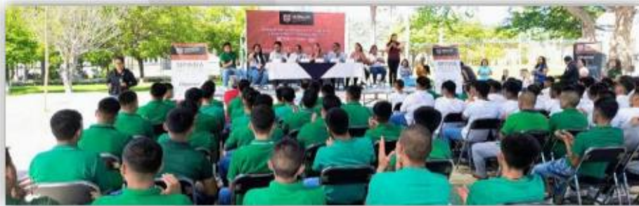
Ceremonia inaugural en el CEMPLA