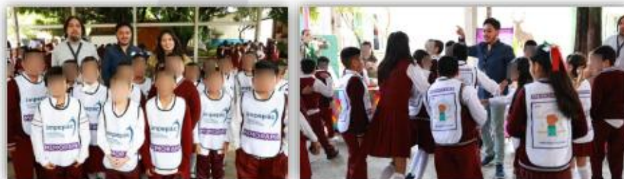
Implementación del juego didáctico "Casacas"

En esta actividad se implementó el juego didáctico denominado "Casacas", consistente en un memorama que contiene hasta 60 conceptos democráticos que reta a la memoria de las y los participantes para poder recordar tales conceptos e ir encontrando pares, la actividad fomenta promoción de la cultura cívica y democrática en el alumnado de dicha institución educativa.