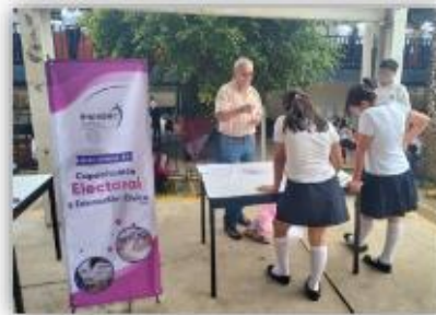
Implementación del juego didáctico "Serpientes y Escalares" así como la "Lotería Electoral"