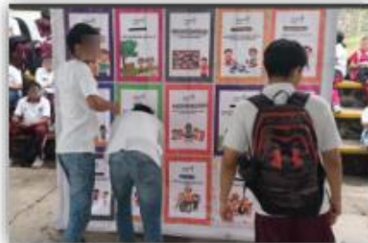
Implementación del juego didáctico "Pared de Valores"