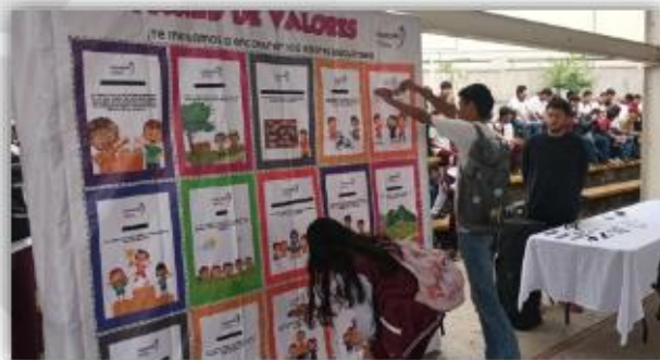
Implementación del juego didáctico "Pared de Valores"

número 12, ubicado en avenida de los 50 Metros, CIVAC, Primera Sección, del municipio de Jiutepec, Morelos: