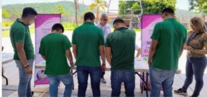
Implementación del juego didáctico "Lotería Electoral"

promoción de la cultura cívica y democrática en el alumnado de dicho Centro.