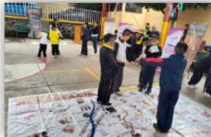
Implementación del juego didáctico "Serpientes y Escalares"