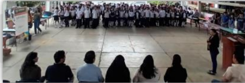
Ceremonia inaugural del Colegio Bachilleres plantel 01

Domingo 10, sin número, colonia Chamilpa, del municipio de Cuemavaca, Morelos a efecto de sumarnos a las actividades de la Kermés Patria "Conociendo mis Raíces, Morelos":